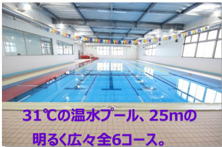
31℃の温水プール、25mの 明るく広々全6コース。