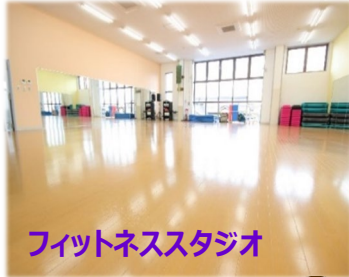
フィットネススタジオ